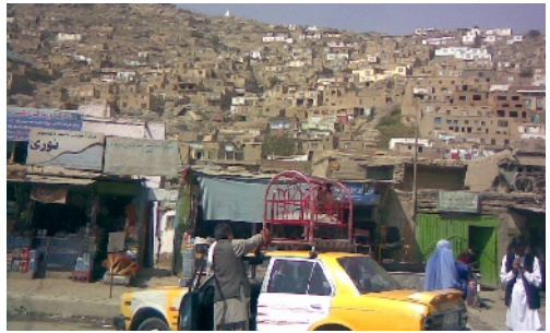
Taxi mit Babywiege auf dem Dachgepäckträger

Der Frühling ist in vollem Schwunge, die Rosen blühen überall, es ist schön warm, aber noch nicht zu heiß, und die Sandstürme ziehen über die Stadt. Alle Türen und Fenster klappern, der Staub kommt durch die kleinsten Ritzen und legt sich auf alle Oberflächen.